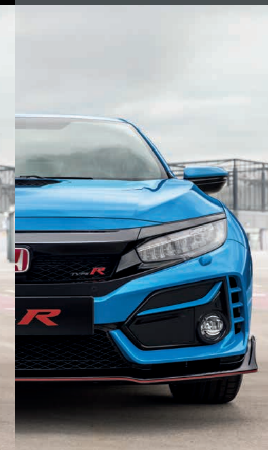
RACING BLUE PEARL