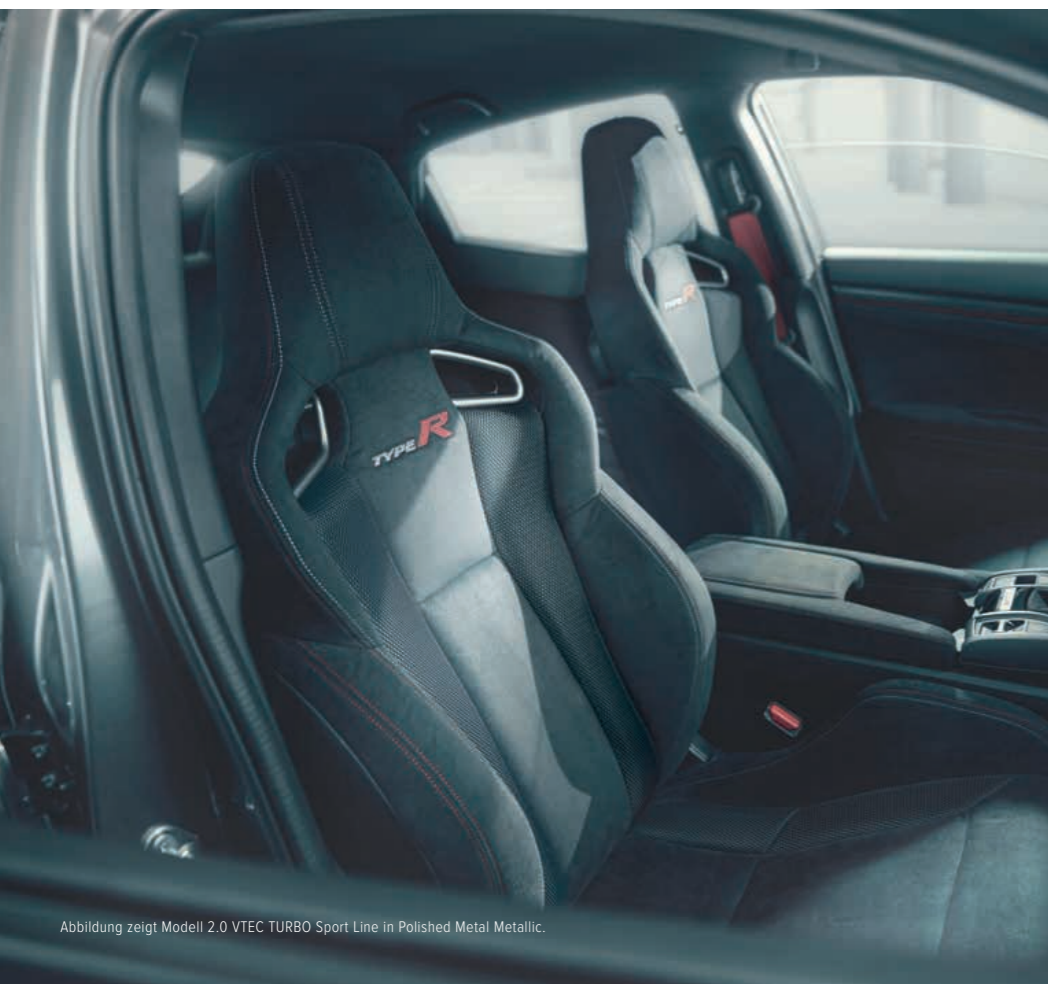
Abbildung zeigt Modell 2.0 VTEC TURBO Sport Line in Polished Metal Metallic.

* Weitere Informationen zur Verfügbarkeit und Funktionalität dieser sowie anderer Ausstattungsmerkmale finden Sie ab Seite 28.