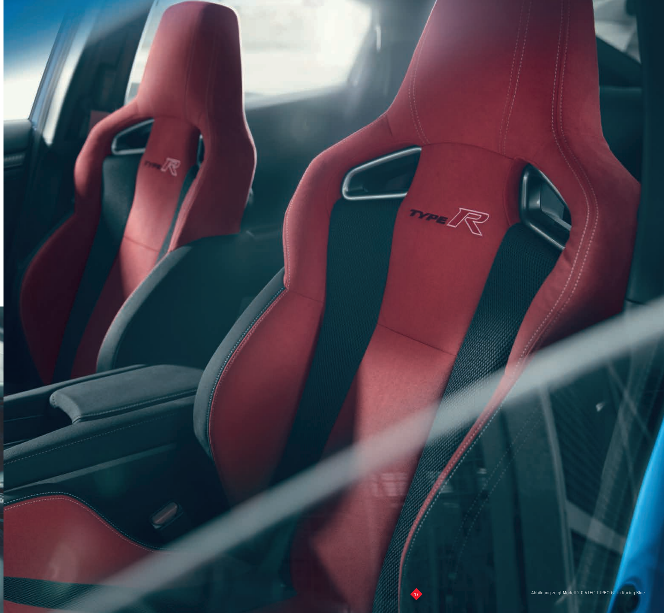
Abbildung zeigt Modell 2.0 VTEC TURBO GT in Racing Blue.