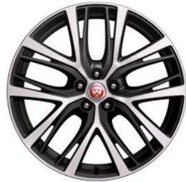
20" MIT 5 DOPPELSPEICHEN POLISHED TECHNICAL GREY (STYLE 5070)