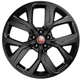
20" MIT 5 SPEICHEN, GLOSS BLACK (STYLE 5068)