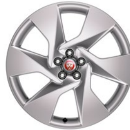
20" MIT 6 SPEICHEN GLOSS SPARKLE SILVER (STYLE 6007)