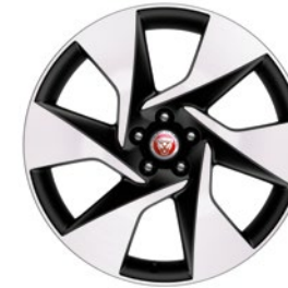
20" MIT 6 SPEICHEN GLOSS DARK GREY CONTRAST DIAMOND TURNED (STYLE 6007)