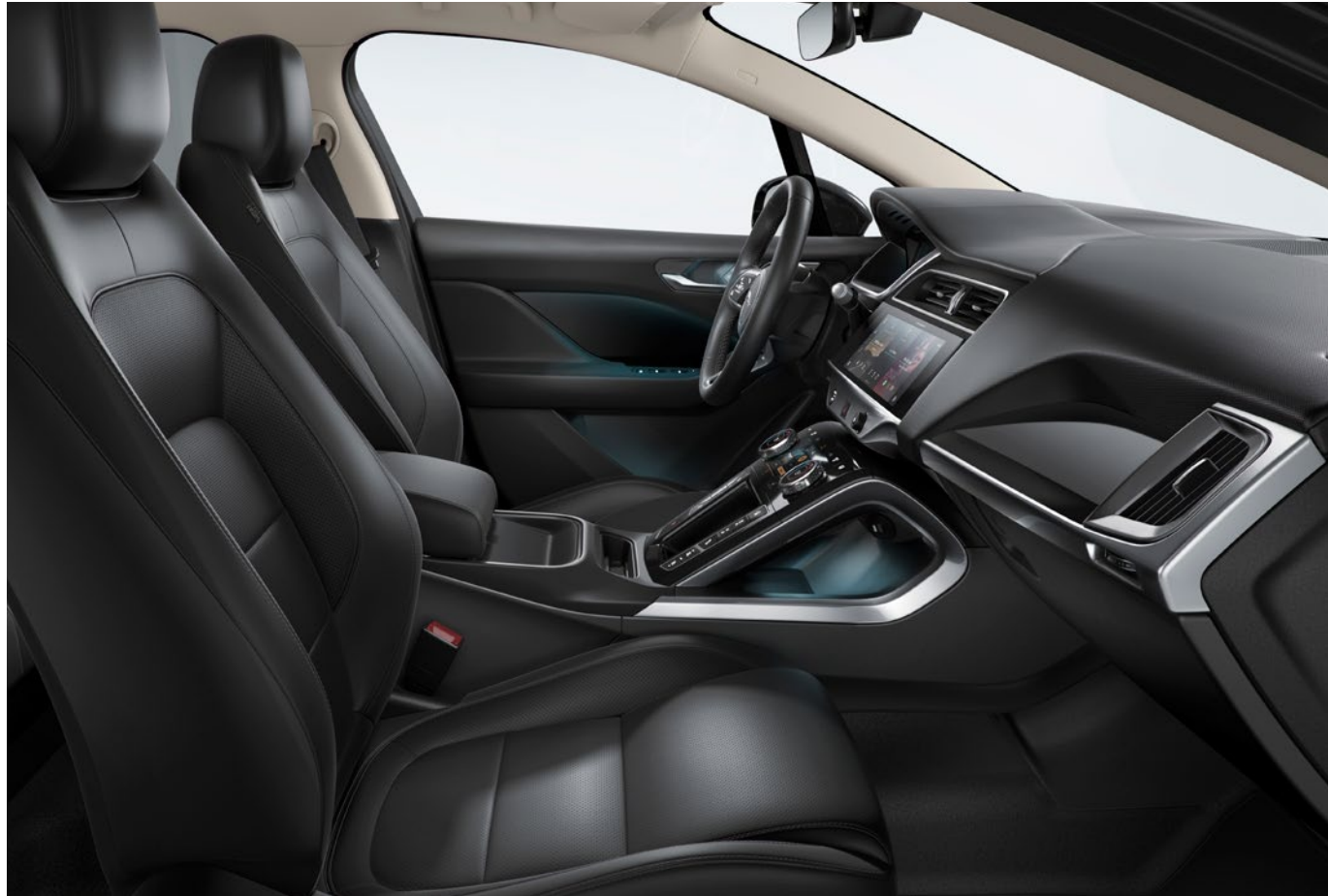
ABGEBILDETES FAHRZEUG: I-PACE S MIT SONDERAUSSTATTUNG