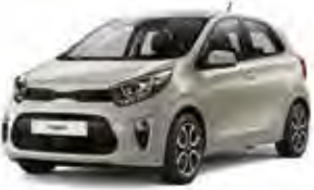
Milky Beige (M9Y) 2