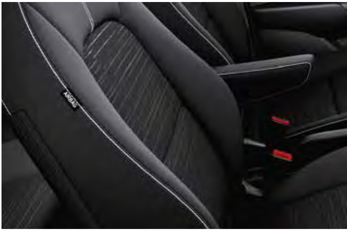
NEON & TITAN Innenkonzept Schwarz Schwarze Textilsitze