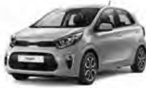
Sparkling Silver (KCS) 2