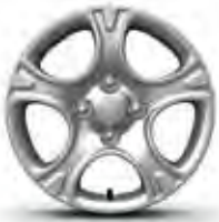
Neon & Titan Stahlfelgen mit Radzierkappen 14" mit 175/65 R14 Bereifung