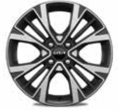
GT-Line & X-Line Leichtmetallfelgen 16" mit 195/45 R16 Bereifung

Informationen zu den Reifen in Bezug auf Kraftstoffeffizienz und andere Parameter gemäß Verordnung (EU) 2020/740 finden Sie auf unserer Website unter www.kia.com/at/kaufberater/reifenlabel-information