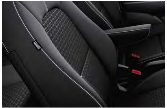
SILBER & GOLD Innenkonzept Schwarz Schwarze Textilsitze