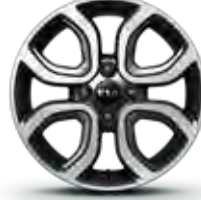
Gold Leichtmetallfelgen 15" mit 185/55 R15 Bereifung