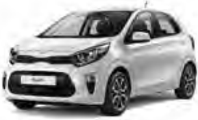
Clear White (UD) 1