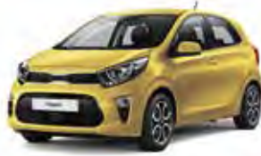
Honey Bee (B2Y) 2*