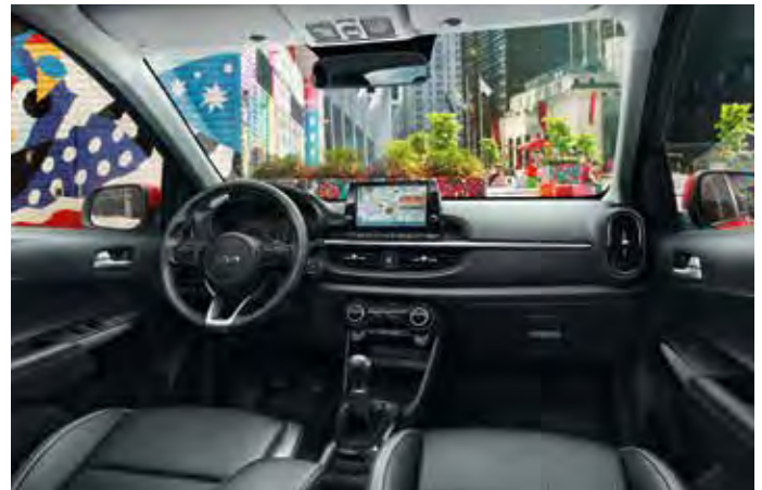
X-LINE Innenkonzept - Schwarz/Limettengrün Kunstledersitze mit grauen und limettengrünen Highlights