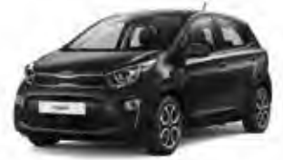
Aurora Black Pearl (ABP) 3