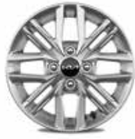
Silber Leichtmetallfelgen 14" mit 175/65 R14 Bereifung