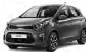
Astro Grey (MG7) 2