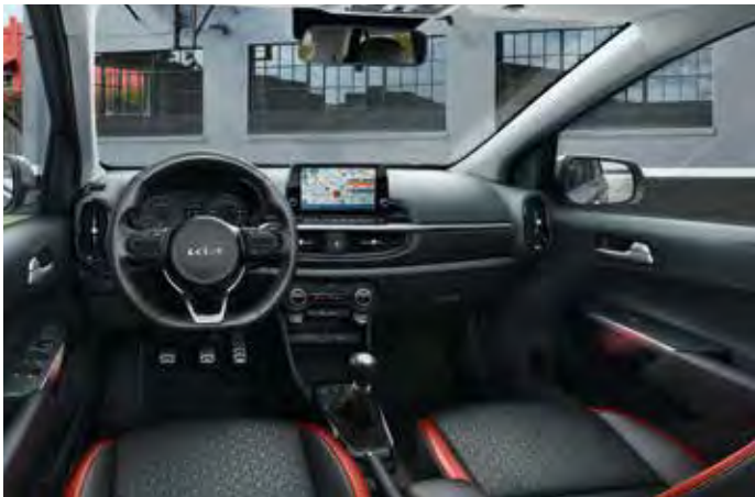
GT-LINE Innenkonzept - Schwarz/Rot Kunstledersitze mit roten Applikationen