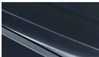
EU3 - Smoke Blue 2