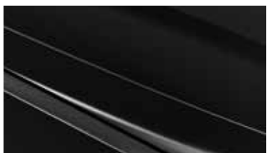
ABP - Aurora Black 2