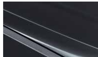
ABT - Platinum Graphite 2