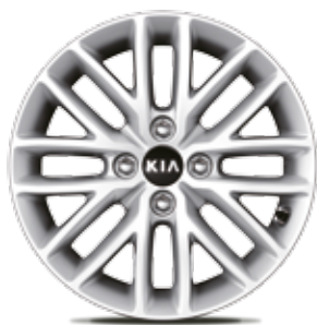
Leichtmetallfelge 15 Zoll mit 185/65 R15

Die abgebildeten Farben können vom Originalton abweichen.