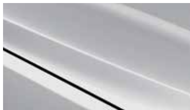
4SS - Silky Silver 2