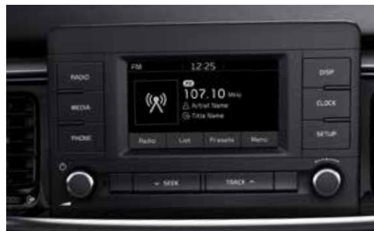
RDS-Radio mit 5" LCD Display und Rückfahrkamera