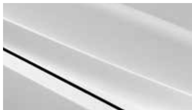
UD - Clear White 1