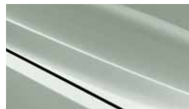
URG - Urban Green 2