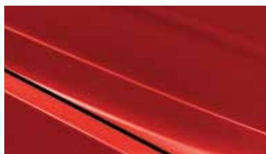
BEG - Signal Red 2