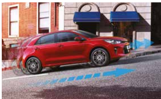
HAC - Berganfahrassistent