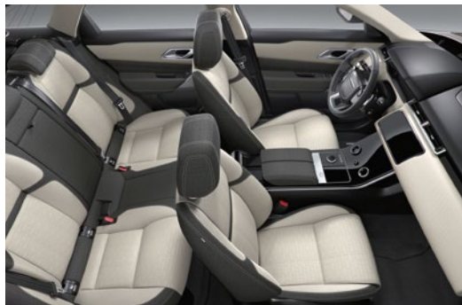
Dapple Grey/Light Oyster