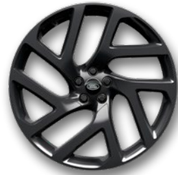
22" 5 DOPPELSPEICHEN, GLOSS DARK GREY (STYLE 5113)*