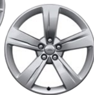
19" 5 SPEICHEN (STYLE 5046)