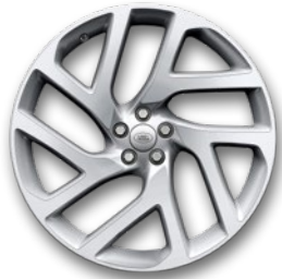
22" 5 DOPPELSPEICHEN, GLOSS SPARKLE SILVER, DIAMOND TURNED (STYLE 5113)*