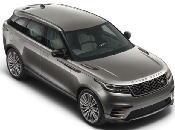
Dach in Wagenfarbe Seriensausstattung