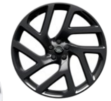
21" 5 DOPPELSPEICHEN, DIAMOND TURNED (STYLE 5047)*