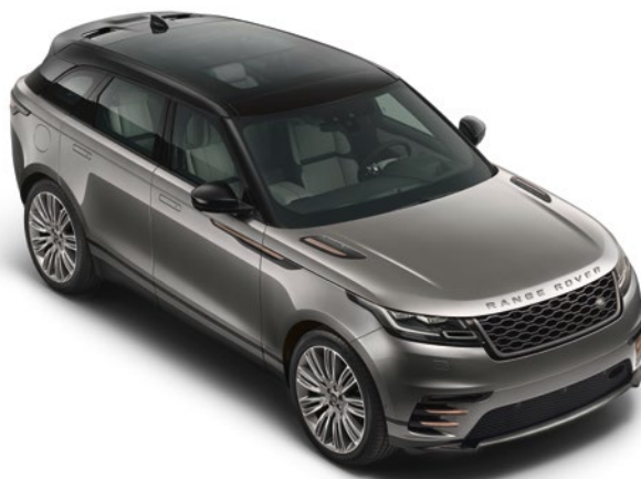
Dach in Kontrastlackierung – Schwarz 2 mit Panoramdach mit elektrischer Sonnenblende Sonderausstattung