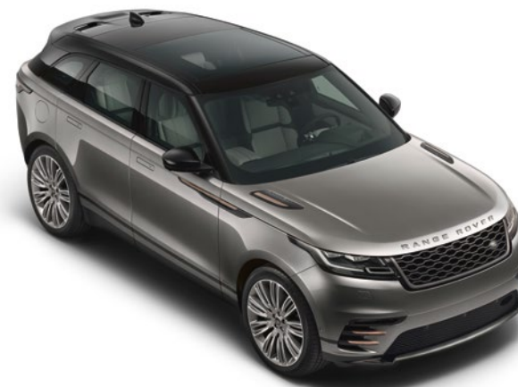
Dach in Kontrastlackierung – Schwarz 2 mit Panoramaschiebedach 1 mit elektrischer Sonnenblende Sonderausstattung (Seriensausstattung für SVAutobiography Dynamic Edition)