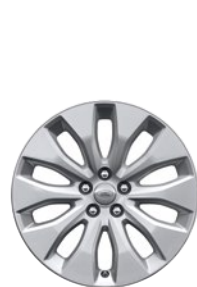
18" 10 SPEICHEN (STYLE 1021)