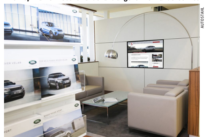
Die neue Lounge bietet Ruhe, Information – und perfekten Kaffee