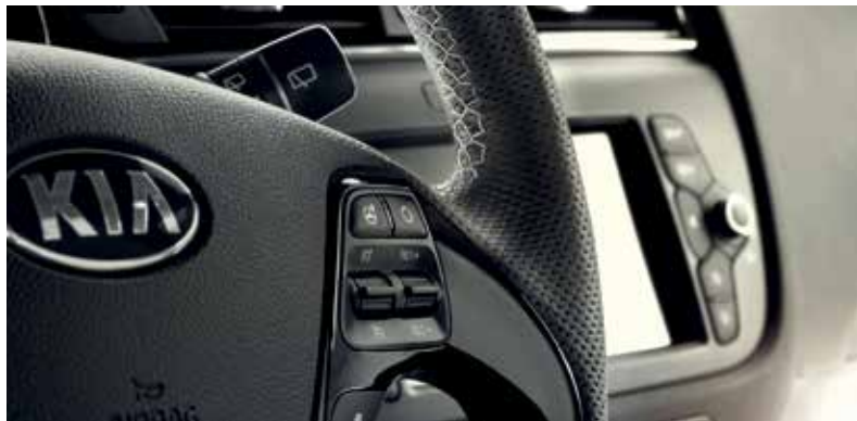
Lederlenkrad mit grauen Ziernähten