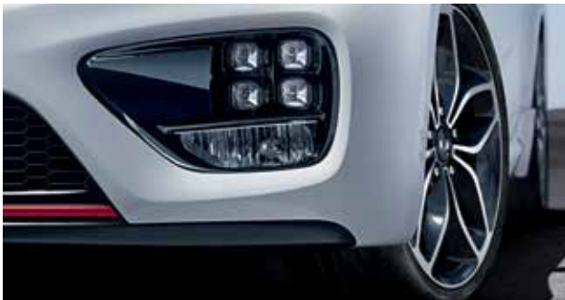
GT-Frontschürze mit LED-Tagfahrlicht in Icecube-Design