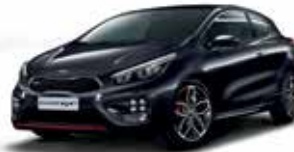
1K - Black Pearl 2