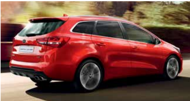
Kia cee'd_SW GT-Line