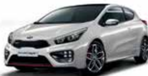
KCS - Sparkling Silver 2