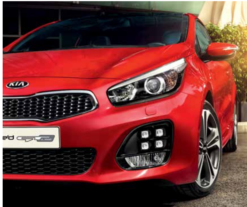
Kühlergrill mit LED Tagfahrlicht in Ice-Cube Design