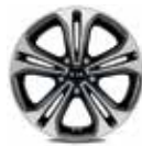
Leichtmetallfelge 17 Zoll mit 225/45 R17