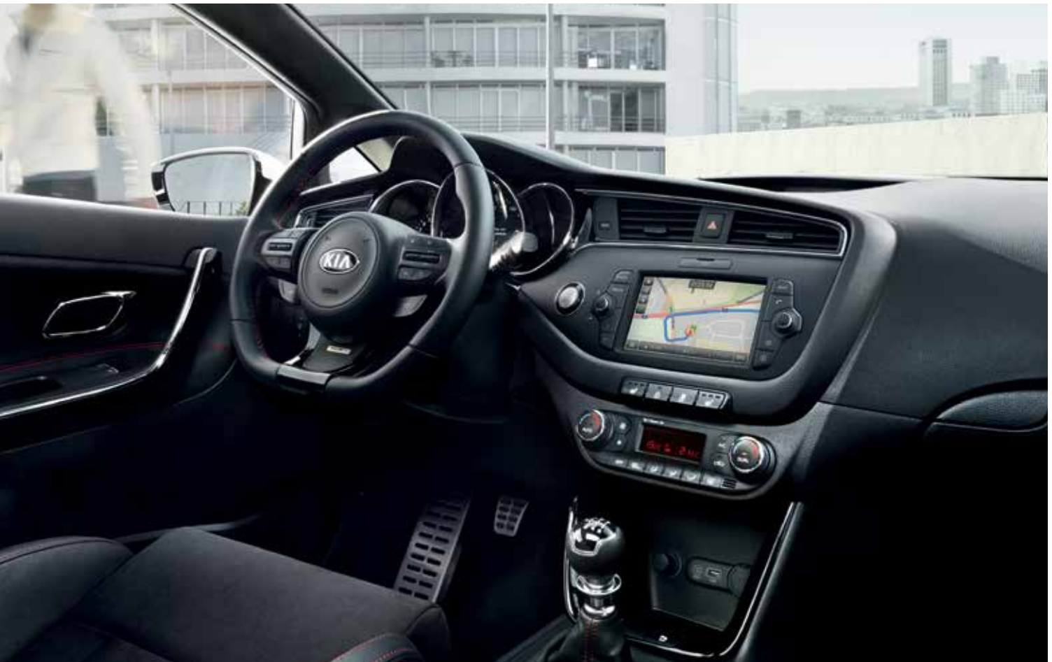
Innenraum der GT-Variante