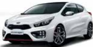
HW2 - Delux White 2