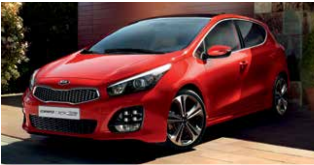
Kia cee'd GT-Line