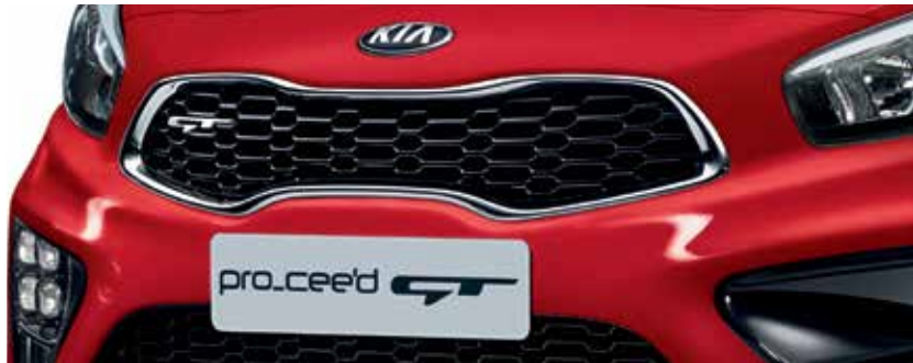
Kühlergrill in GT-Design