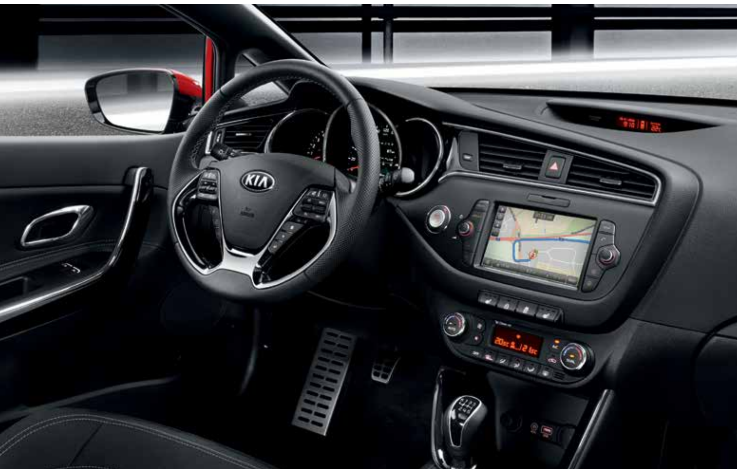
Innenraum der GT-Line Variante