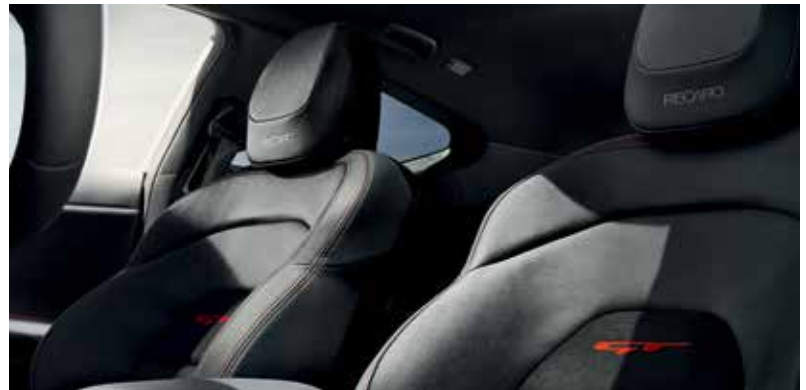
Recaro Sportledersitze in GT-Design