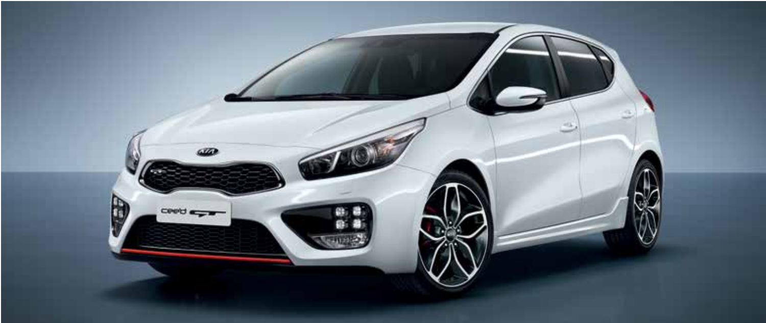
Kia cee'd GT