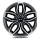
Leichtmetallfelge 18 Zoll mit 225/40 R18

Symbolfotos 1 Solid 2 Mica-/Metallic-/Mehrschichtlackierung Die abgebildeten Farben können vom Originalton abweichen.