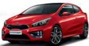
FRD - Track Red 1