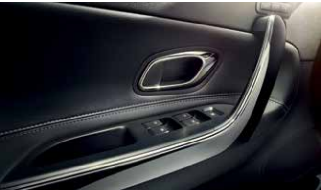
Türverkleidung in Lederoptik mit grauen Ziernähten