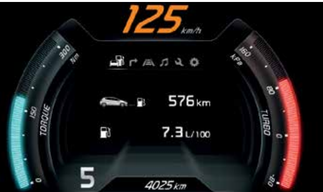
Supervision Cluster inkl. TFT LCD Display mit zuschaltbarem GT-Modus