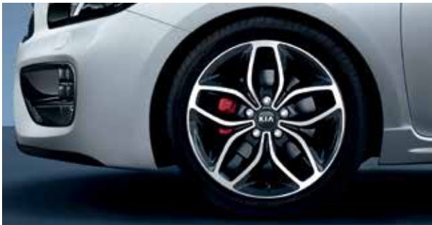
18 Zoll Leichtmetallfelgen 225/40 R18 mit rot lackierten Bremssätteln