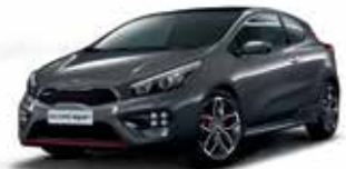
E5B - Dark Gun Metal 2