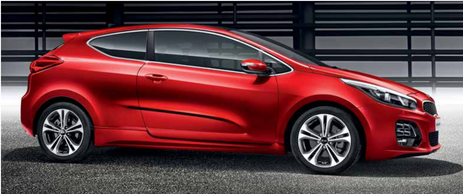
Kia pro_cee'd GT-Line