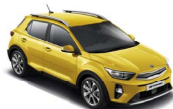
MYW - Most Yellow 2