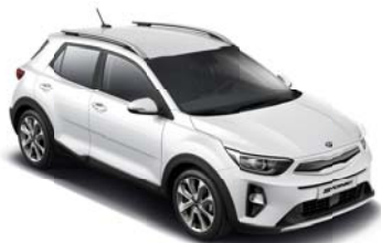
UD - Clear White 1