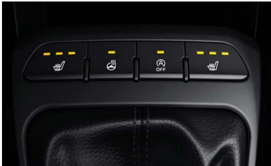
Sitzheizung vorne sowie Lenkradheizung