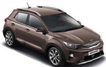
SEN - Deep Sienna Brown 2