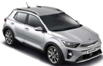
4SS - Silky Silver 2