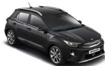
ABP - Aurora Black 2