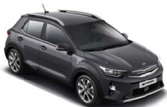
ABT - Platinum Graphite 2