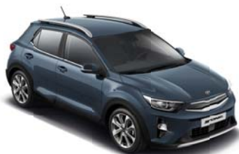
EU3 - Smoke Blue 2