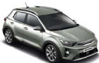
URG - Urban Green 2