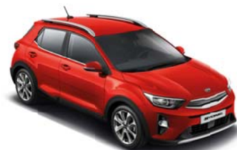
BEG - Signal Red 2