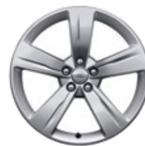
19" 5 SPEICHEN (STYLE 5046)