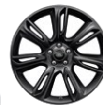
20" 7 DOPPELSPEICHEN, GLOSS BLACK (STYLE 7014)