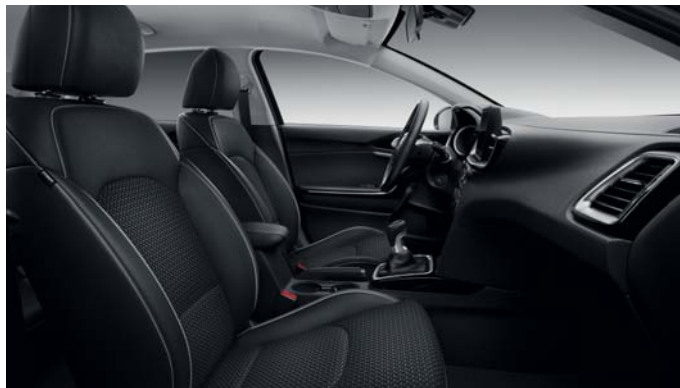
WK - Schwarz Textilsitze mit Kunstlederapplikationen