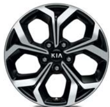
Räder 17 Zoll mit 225/45 R17 Bereifung, Leichtmetallfelgen