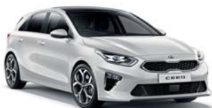
Deluxe White (HW2) 2