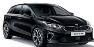
Black Pearl (1K) 2