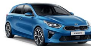
Blue Flame (B3L) 1