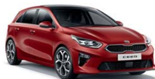
Infra Red (AA9) 1*