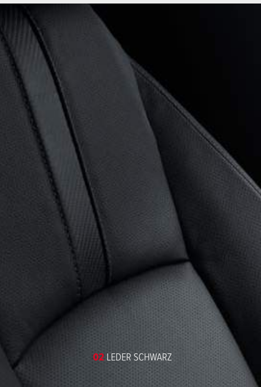
02 LEDER SCHWARZ