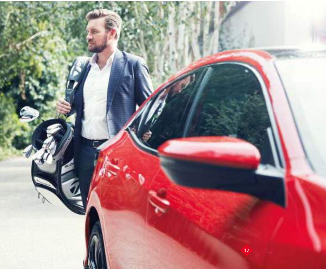
Abbildung zeigt Modell 1.5 VTEC TURBO Sport Plus in Rallye Red.

Wir wollten ein perfektes Auto für Ihren Alltag, ein Auto, das eines der geräumigsten in seiner Klasse und flexibel genug ist, um alles zu meistern, was das Leben mit sich bringt. Der Civic verfügt über viele durchdachte Details wie eine breite Heckklappenöffnung, um das Be- und Entladen zu erleichtern, eine vielseitige, im Verhältnis 60:40 teilbare Rückbank und eine intelligente Gepäckraumabdeckung, die nicht nur abnehmbar ist, sondern sowohl links als auch rechts angebracht und mit einer Hand bedient werden kann.