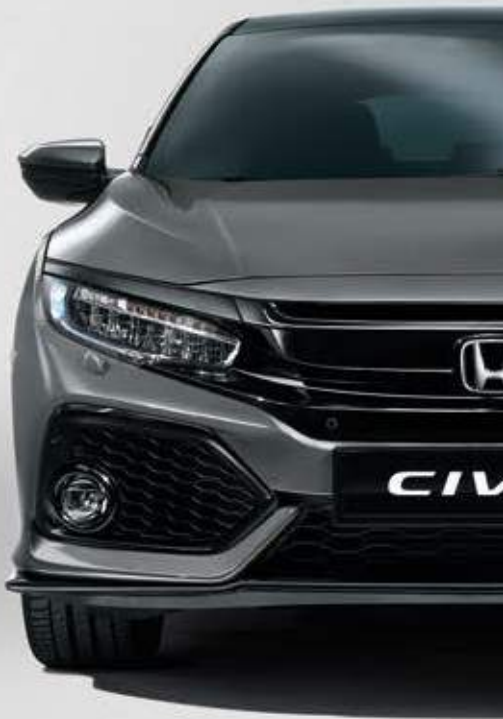
POLISHED METAL METALLIC