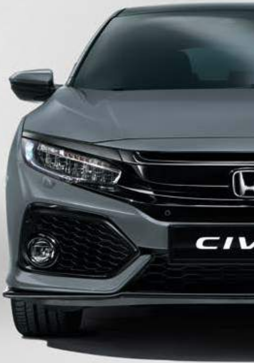
SONIC GREY PEARL