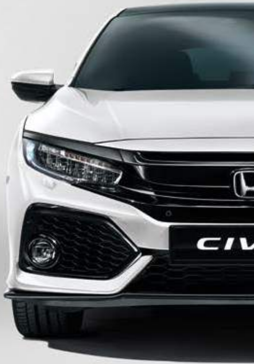
WHITE ORCHID PEARL