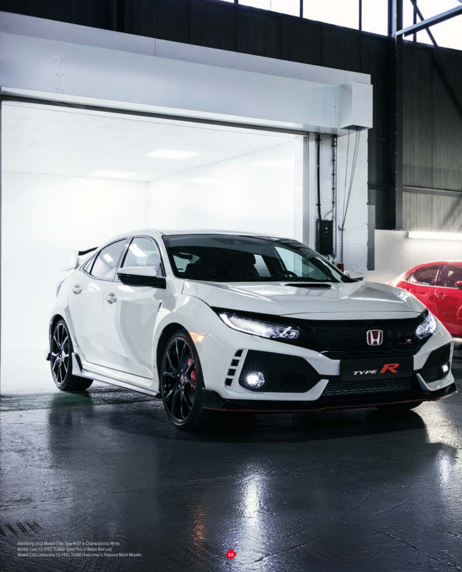
Abbildung zeigt Modell Civic Type R GT in Championship White, Modell Civic 1.5 VTEC TURBO Sport Plus in Rallye Red und Modell Civic Limousine 1.5 VTEC TURBO Executive in Polished Metal Metallic.