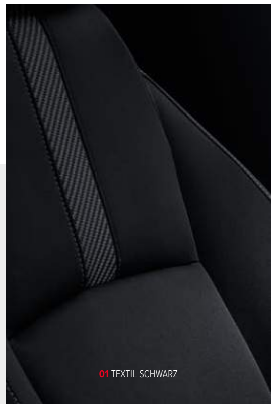
01 TEXTIL SCHWARZ

2) Optional für Modell Executive als Teil des Premium-Pakets verfügbar, zu dem auch Sitzheizung hinten und induktives Ladepad gehören.