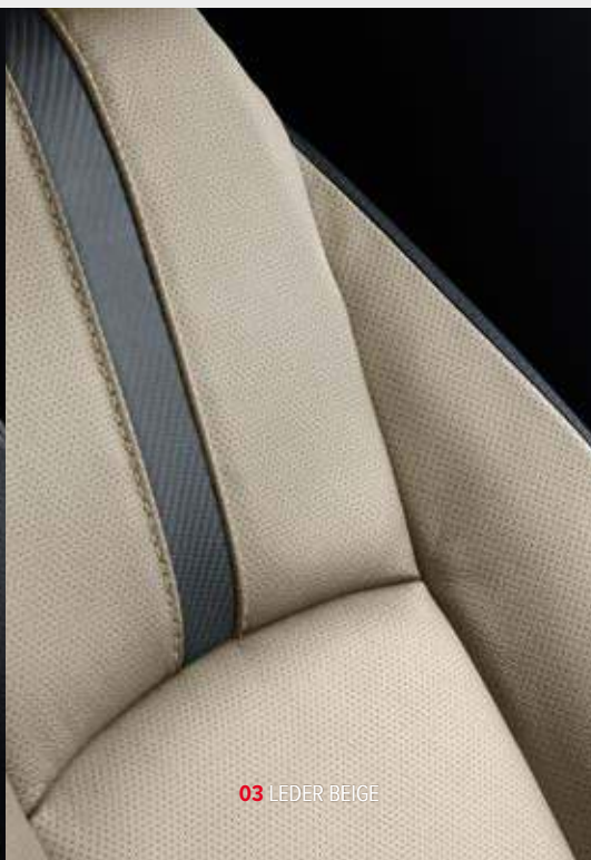
03 LEDER BEIGE