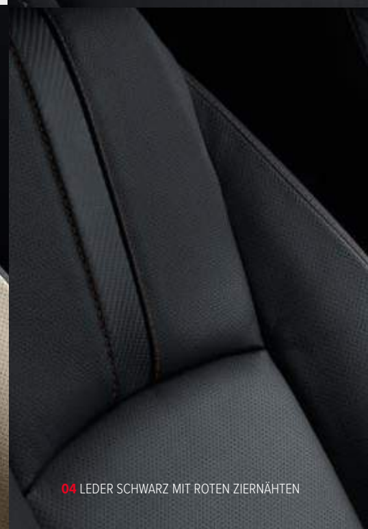
04 LEDER SCHWARZ MIT ROTEN ZIERNÄHTEN