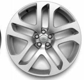
20" 5 DOPPELSPEICHEN GLOSS MID-SILVER, CONTRAST DIAMOND TURNED (STYLE 5076)