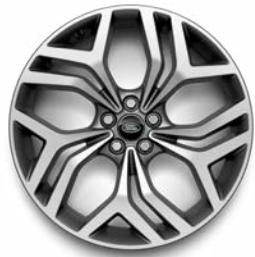
20" 5 DOPPELSPEICHEN DIAMOND TURNED (STYLE 5079)