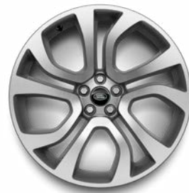
21" 5 DOPPELSPEICHEN GLOSS LIGHT SILVER, CONTRAST DIAMOND TURNED (STYLE 5077) 1