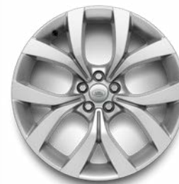
17" 10 SPEICHEN SATIN DARK GREY (STYLE 1005)