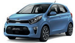
Alice Blue (ABB) 1