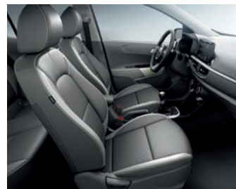
X-LINE CGK - Grau/Limettengrün Kunstledersitze