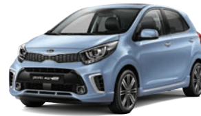
Celestial Blue (CU3) 2