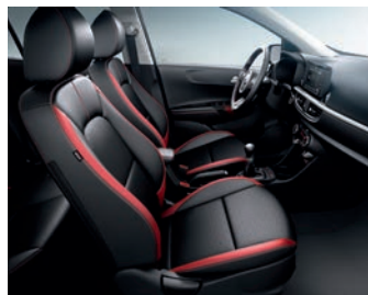
GT-LINE WK - Schwarz/Rot Kunstledersitze