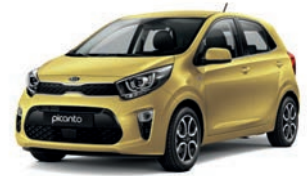
Honey Bee (B2Y) 2*