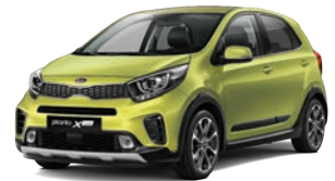
Lime Light (L2E) 2