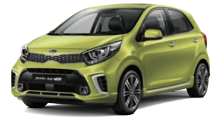
Lime Light (L2E) 2