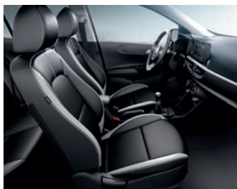
GT-LINE & X-LINE WK - Schwarz Kunstledersitze