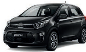
Aurora Black Pearl (ABP) 3