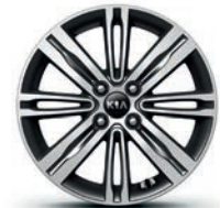
GT-LINE & X-LINE Leichtmetallfelgen 16 Zoll mit 195/45 R16 Bereifung