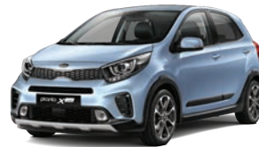
Celestial Blue (CU3) 2