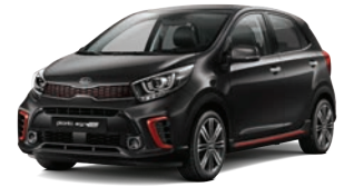
Aurora Black Pearl (ABP) 3