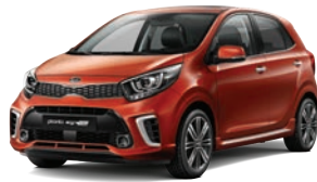
Pop Orange (G7A) 2