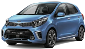
Alice Blue (ABB) 1