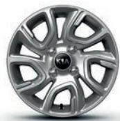
SILBER Leichtmetallfelgen 14 Zoll mit 175/65 R14 Bereifung