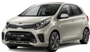
Milky Beige (M9Y) 2