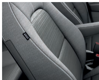
TITAN CGK - Grau Textilsitze