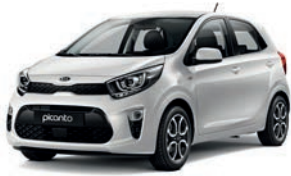
Clear White (UD) 1