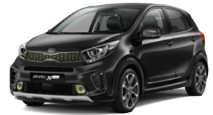
Aurora Black Pearl (ABP) 3