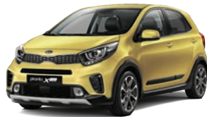
Honey Bee (B2Y) 2