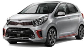
Sparkling Silver (KCS) 2