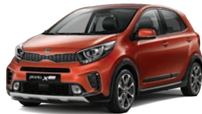
Pop Orange (G7A) 2