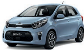
Celestial Blue (CU3) 2