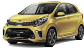
Honey Bee (B2Y) 2*