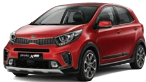
Shiny Red (A2R) 3