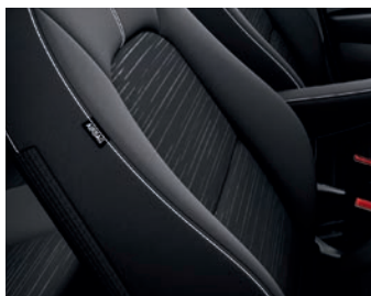
NEON & TITAN WK - Schwarz Textilsitze