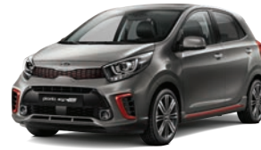
Titanium Silver (IM) 2