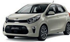
Milky Beige (M9Y) 2