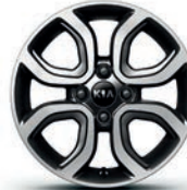
GOLD Leichtmetallfelgen 15 Zoll mit 185/55 R15 Bereifung