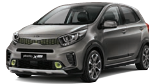
Titanium Silver (IM) 2