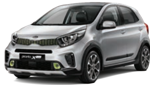
Sparkling Silver (KCS) 2