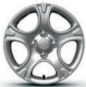
NEON & TITAN Stahlfelgen mit Radzierkappen 14 Zoll mit 175/65 R14 Bereifung