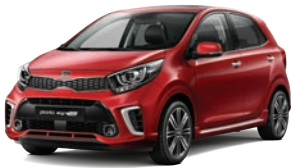
Shiny Red (A2R) 3