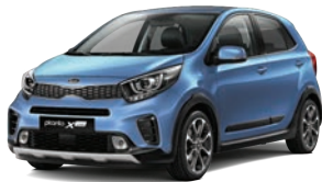
Alice Blue (ABB) 1