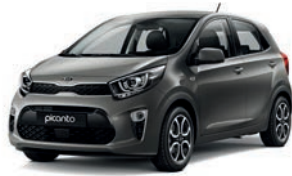
Titanium Silver (IM) 2