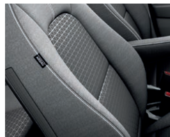
SILBER & GOLD CGK - Grau Textilsitze