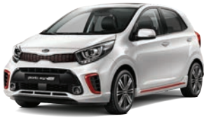
Clear White (UD) 1