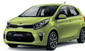
Lime Light (L2E) 2