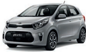
Sparkling Silver (KCS) 2