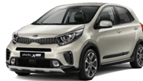
Milky Beige (M9Y) 2