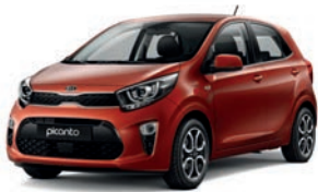
Pop Orange (G7A) 2