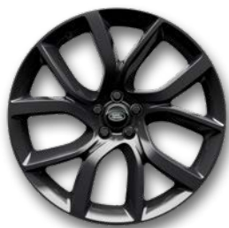
21" 5 DOPPELSPEICHEN, GLOSS DARK GREY (STYLE 5083)