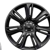
20" 7 DOPPELSPEICHEN, GLOSS BLACK (STYLE 7014)