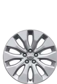
18" 10 SPEICHEN (STYLE 1021)