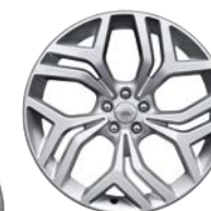
21" 5 DOPPELSPEICHEN (STYLE 5047)