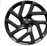
21" 5 DOPPELSPEICHEN, DIAMOND TURNED (STYLE 5047)