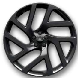
22" 5 DOPPELSPEICHEN, GLOSS DARK GREY (STYLE 5113)*