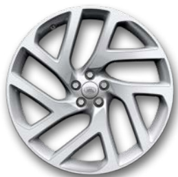
22" 5 DOPPELSPEICHEN, GLOSS SPARKLE SILVER, DIAMOND TURNED (STYLE 5113)*