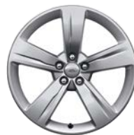
19" 5 SPEICHEN (STYLE 5046)