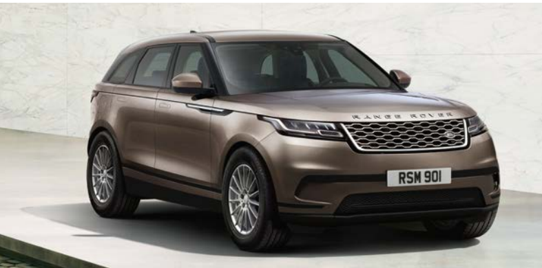
RANGE ROVER VELAR