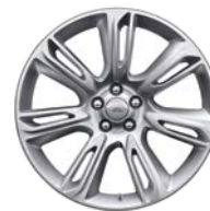
20" 7 DOPPELSPEICHEN (STYLE 7014)