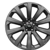
20" 10 SPEICHEN, SATIN DARK GREY (STYLE 1032)