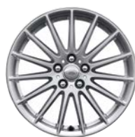
18" 15 SPEICHEN (STYLE 1022)