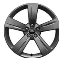
19" 5 SPEICHEN, SATIN DARK GREY (STYLE 5046)