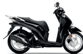
Pearl Nightstar Black