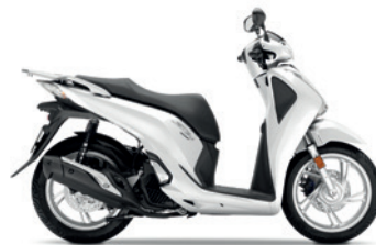
Pearl Cool White