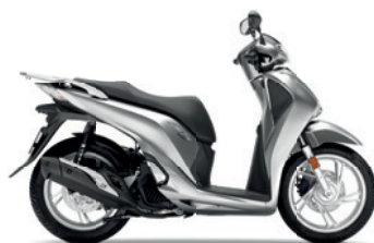
Lucent Silver Metallic