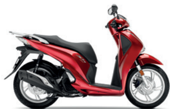
Pearl Splendor Red

Farben Mit diesen Farben bleiben Sie sicher nicht unentdeckt.