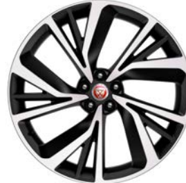
22" MIT 5 DOPPELSPEICHEN, DIAMOND TURNED (STYLE 5056)