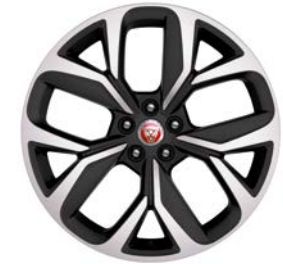
20" MIT 5 SPEICHEN, DIAMOND TURNED (STYLE 5068) Serienausstattung für I-PACE HSE