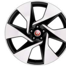
20" MIT 6 SPEICHEN, DIAMOND TURNED (STYLE 6007)