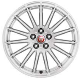
18" MIT 15 SPEICHEN (STYLE 1022) Serienausstattung für I-PACE S