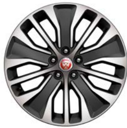
18" MIT 5 DOPPELSPEICHEN, DIAMOND TURNED (STYLE 5055)