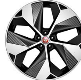
22" MIT 5 SPEICHEN, GLOSS BLACK, DIAMOND TURNED, CARBON INSERTS (STYLE 5069)