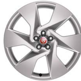
20" MIT 6 SPEICHEN (STYLE 6007) Serienausstattung für I-PACE SE