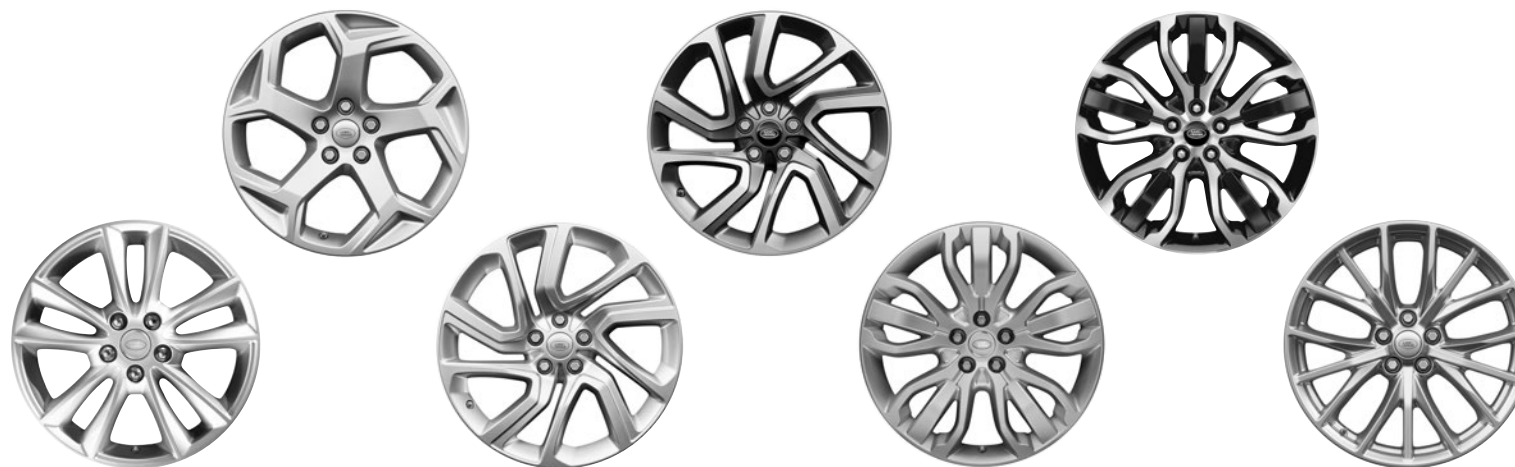
19" 5 DOPPELSPEICHEN (STYLE 5001) 3