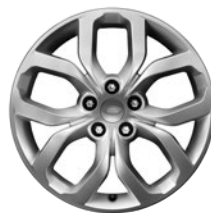
19" 5 DOPPELSPEICHEN (STYLE 5021)