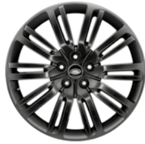
21" 10 DOPPELSPEICHEN GLOSS BLACK (STYLE 1012)