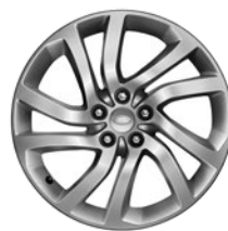
20" 5 DOPPELSPEICHEN (STYLE 5011)