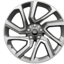
21" 5 DOPPELSPEICHEN GLOSS MID-SILVER, DIAMOND TURNED (STYLE 5085)