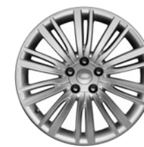
20" 10 DOPPELSPEICHEN (STYLE 1011)