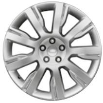
21" 9 SPEICHEN (STYLE 9002)