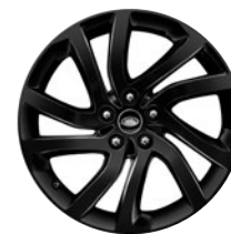
20" 5 DOPPELSPEICHEN GLOSS BLACK (STYLE 5011)