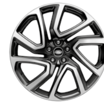
22" 5 DOPPELSPEICHEN SATIN DARK GREY, DIAMOND TURNED (STYLE 5025)