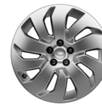
20" 10 SPEICHEN (STYLE 1035)*