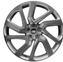
21" 5 DOPPELSPEICHEN SATIN DARK GREY (STYLE 5025)