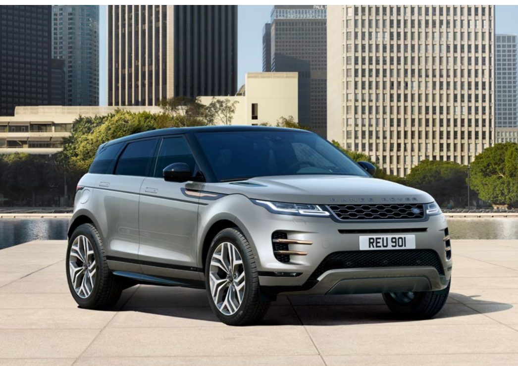
Seoul Pearl Silver

Die First Edition beinhaltet die gesamte Ausstattung des R-Dynamic SE sowie die folgende zusätzliche Serienausstattung: