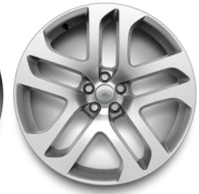
20" 5 DOPPELSPEICHEN GLOSS MID-SILVER, CONTRAST DIAMOND TURNED (STYLE 5076)