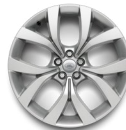
17" 10 SPEICHEN SATIN DARK GREY (STYLE 1005)