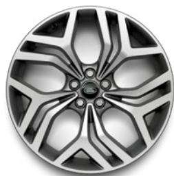
20" 5 DOPPELSPEICHEN DIAMOND TURNED (STYLE 5079) Serienausstattung für First Edition