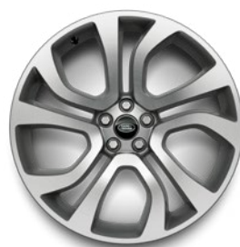
21" 5 DOPPELSPEICHEN GLOSS LIGHT SILVER, CONTRAST DIAMOND TURNED (STYLE 5077) 1