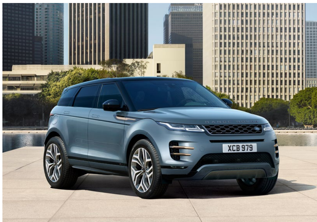
Nolita Grey 1