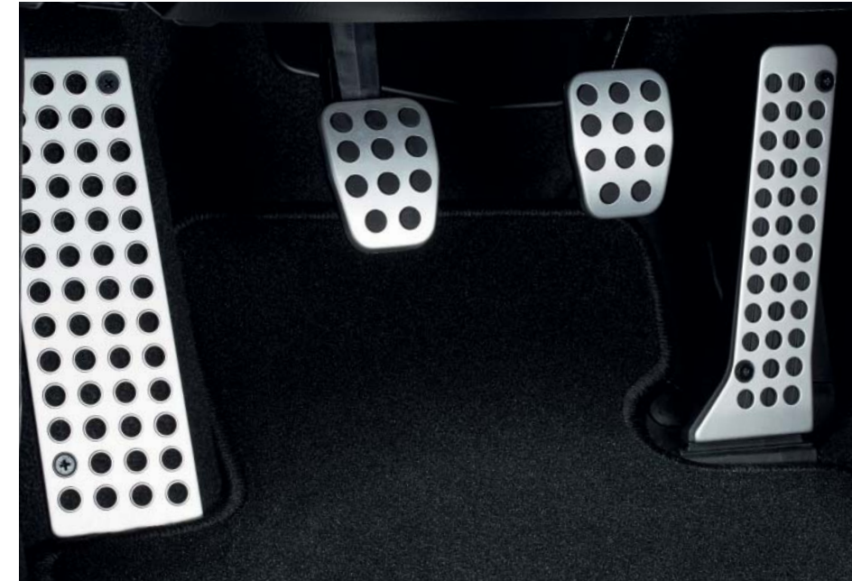
Pedalerie und Fußstütze aus Aluminium

Wir haben Accessoires geschaffen, die perfekt zu Ihrem Mazda2 passen. Entdecken Sie unser facettenreiches Zubehörangebot auf www.mazda.at