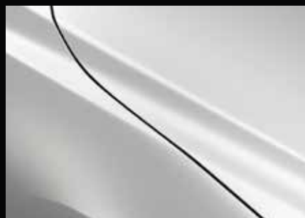
SNOWFLAKE WEISS 25D