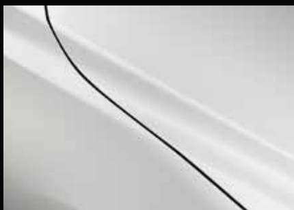
ARCTIC WEISS A4D