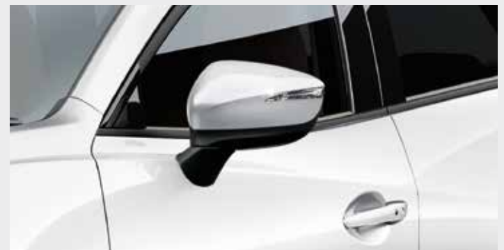
AUTOMATISCH ANKLAPPBARE AUSSENSPIEGEL