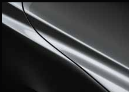
MACHINE GRAU 46G