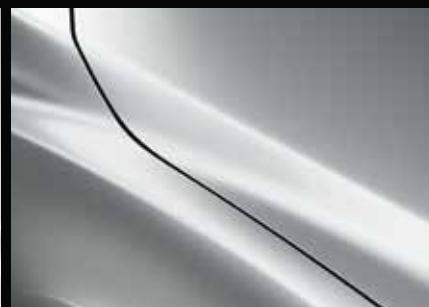
CERAMIC SILBER 47A