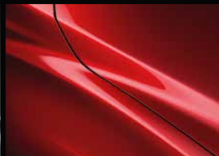
CRYSTAL SOUL ROT 46V