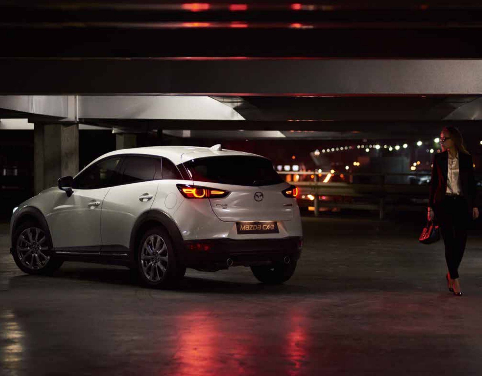
MAZDA CX-3 TAKUMI PLUS