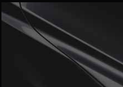
JET SCHWARZ 41W