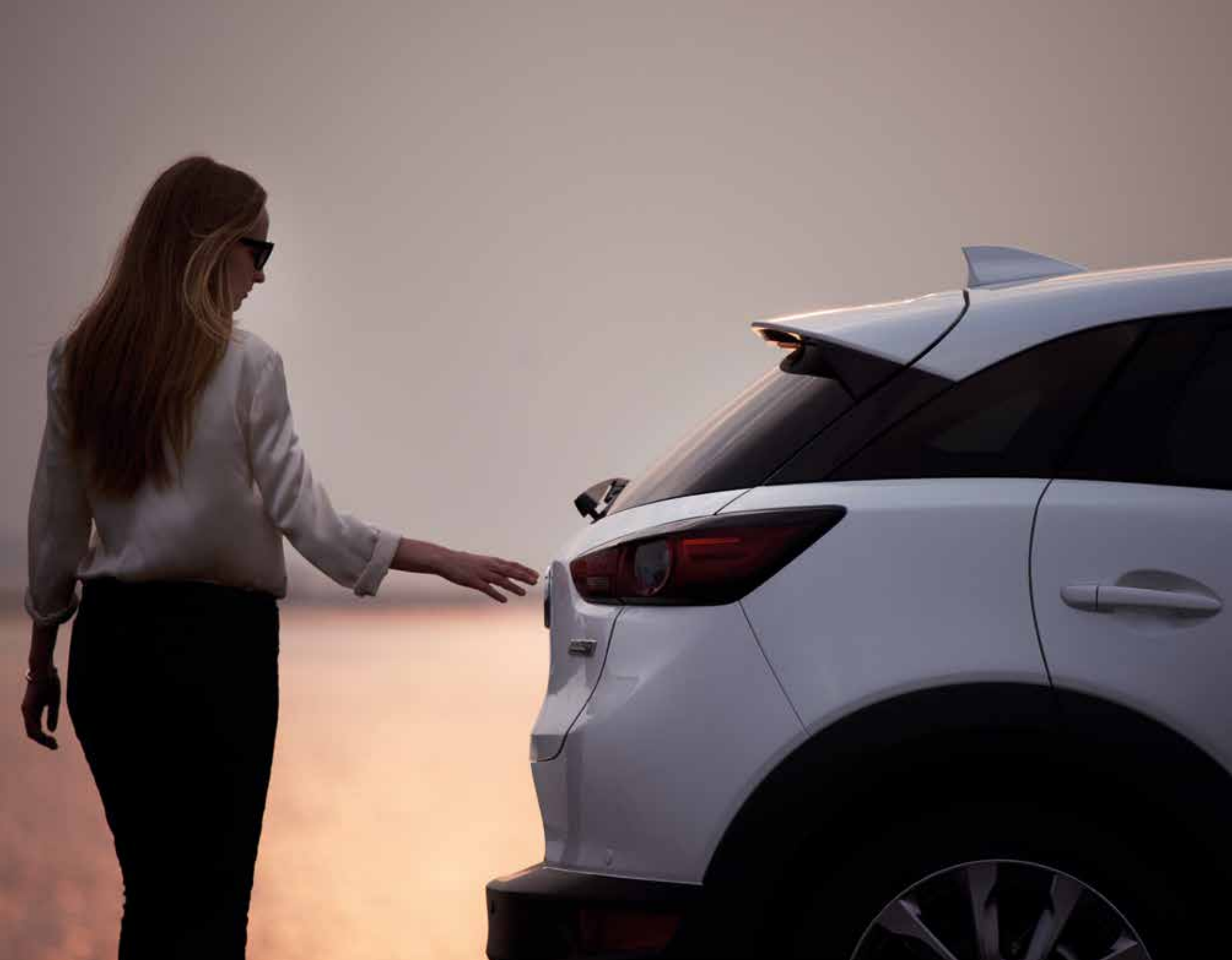
MAZDA CX-3 TAKUMI PLUS