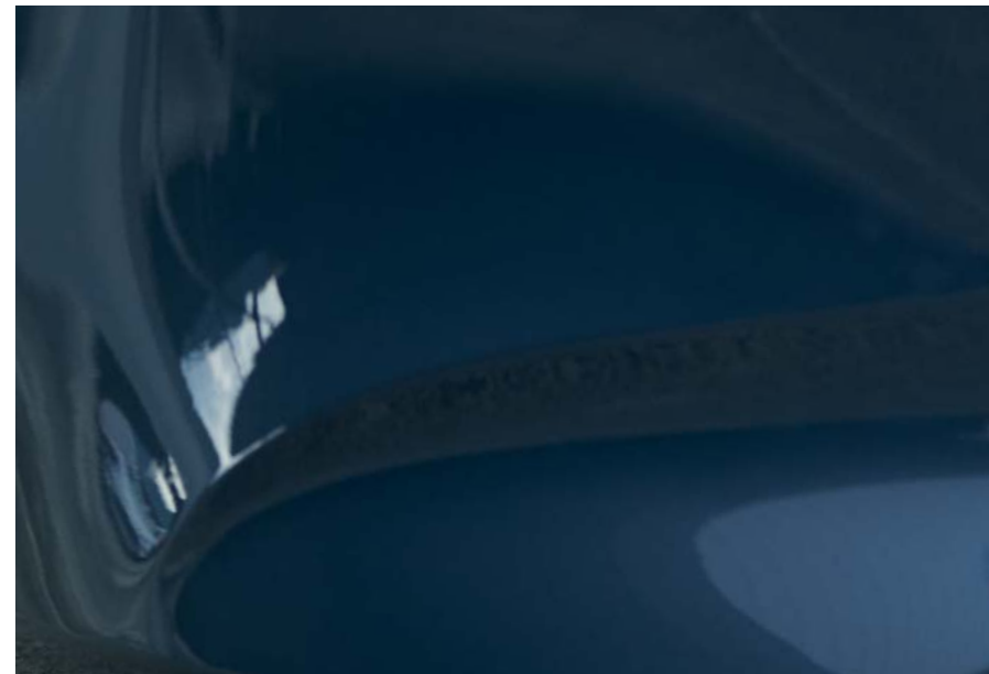
Deep Crystal Blau