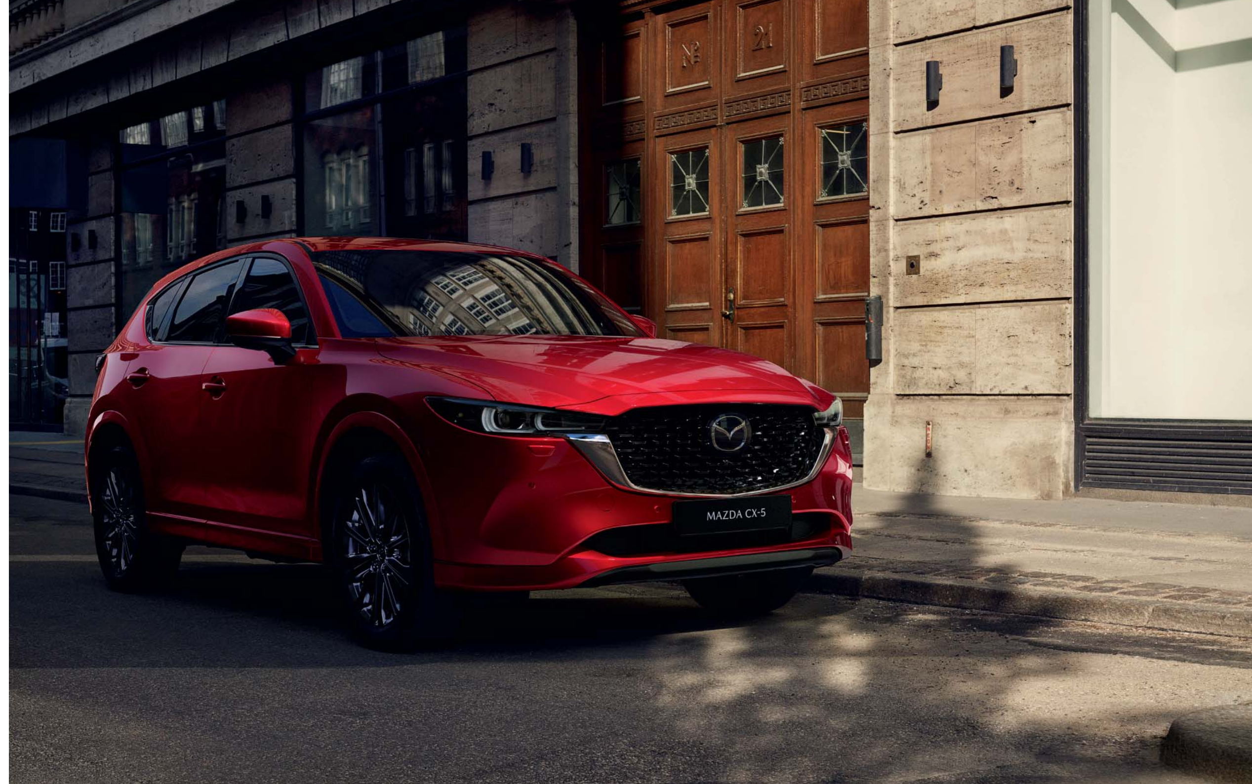
Der Mazda CX-5 in der Ausstattung Takumi Plus