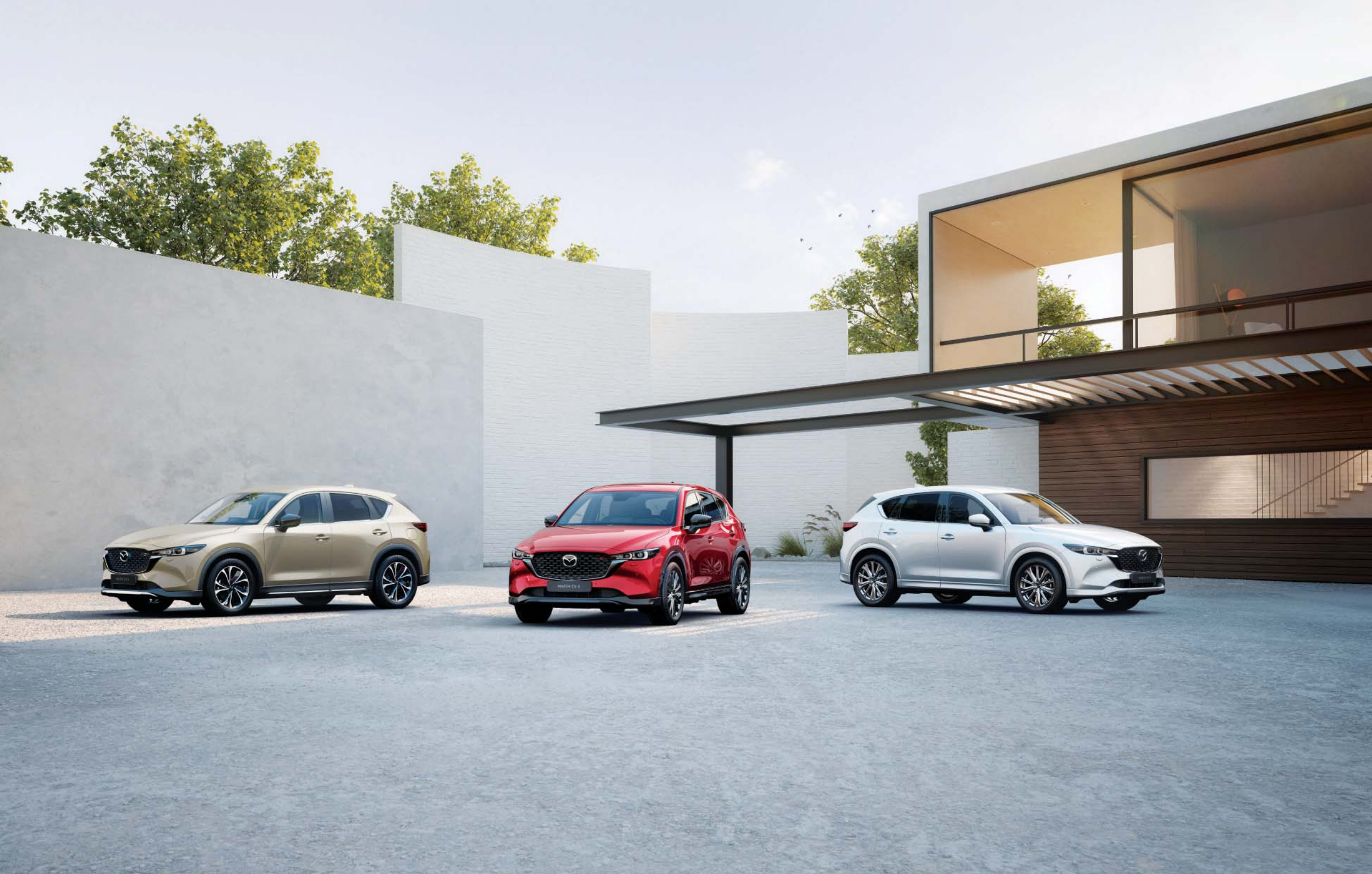
Der Mazda CX-5 2022 in den Ausstattungen Newground, Homura Plus und Takumi Plus