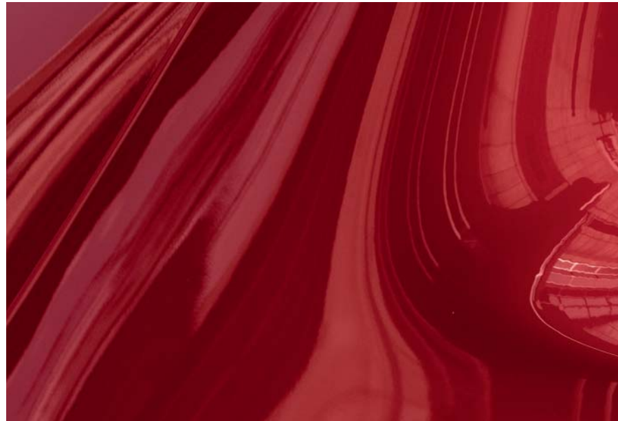
Crystal Soul Rot