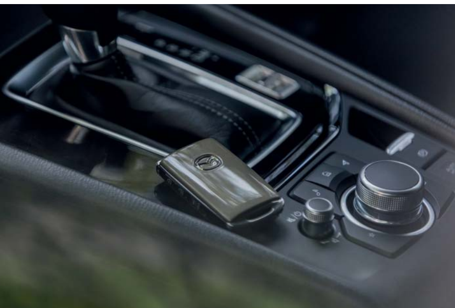
Schlüssel in der Fahrzeugfarbe

Wir haben Accessoires geschaffen, die perfekt zu Ihrem Mazda CX-5 2022 passen. Entdecken Sie unser facettenreiches Zubehörangebot auf mazda.at