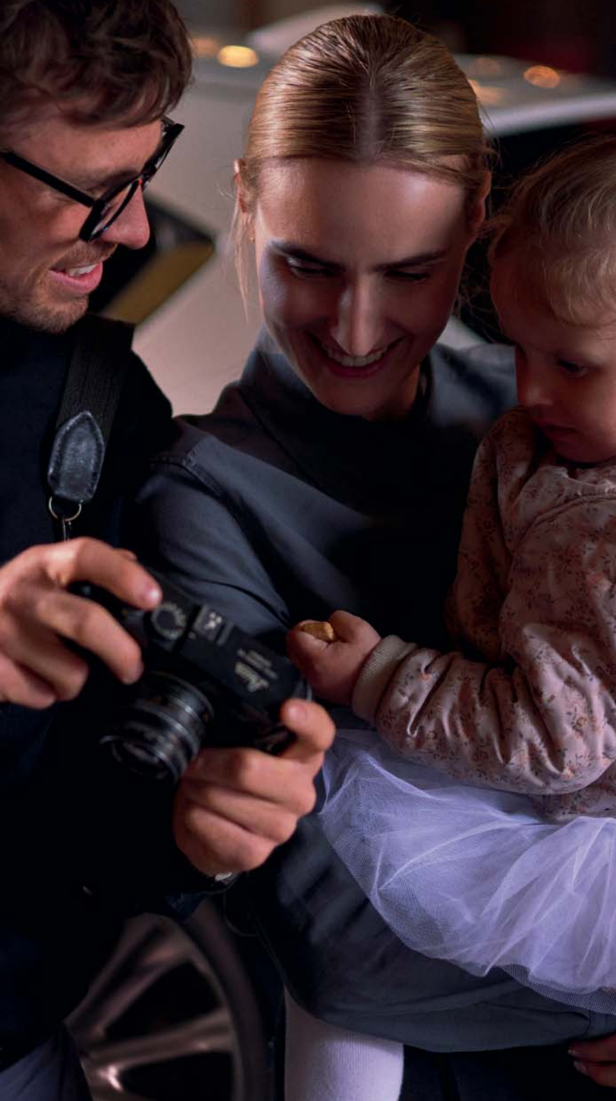
Der Innenraum des Mazda CX-5 2022