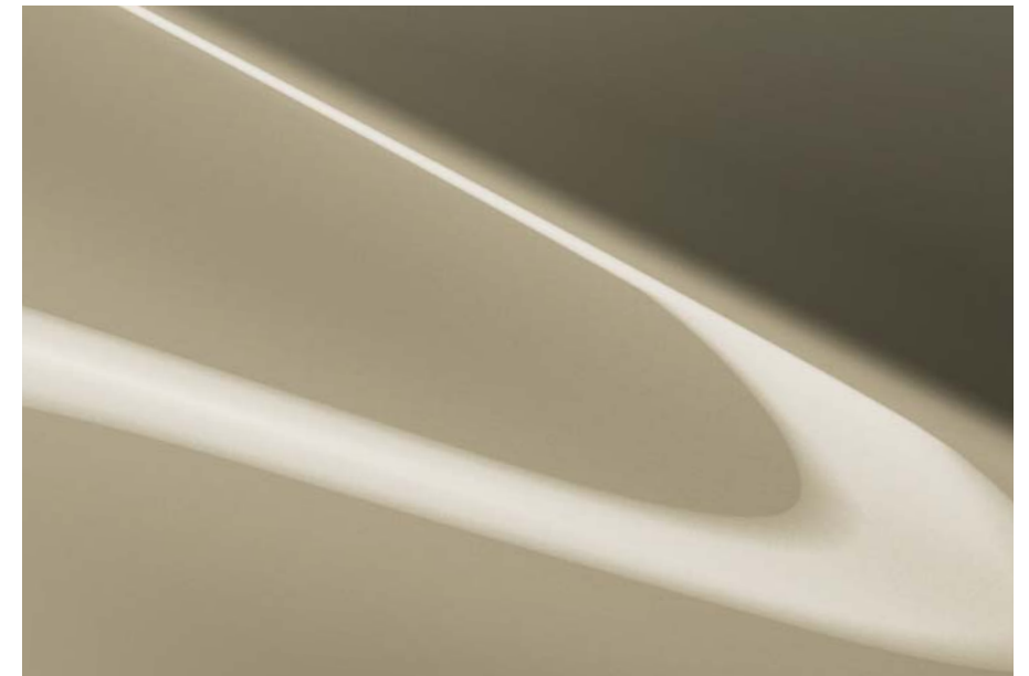
Zircon Sand Metallic