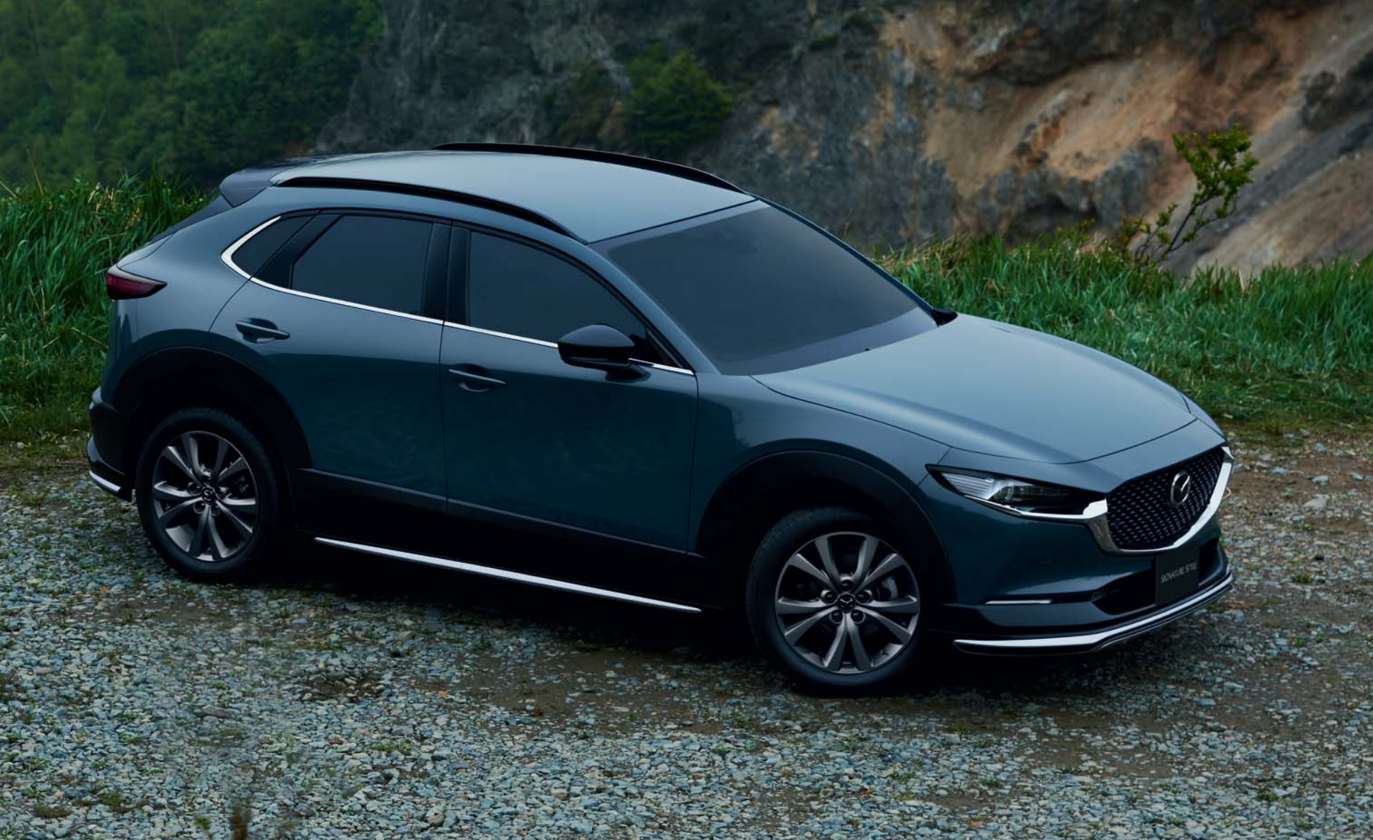
Frontschürze und Seitenschweller in Klavierlack