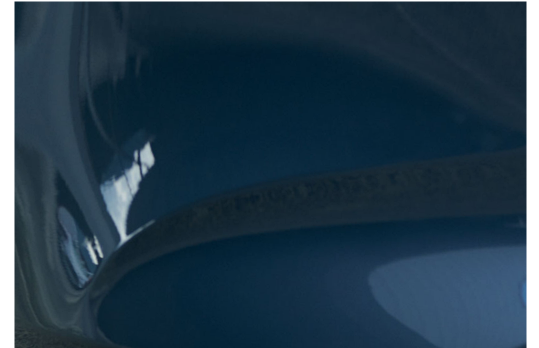
Polymetal Grau Metallic