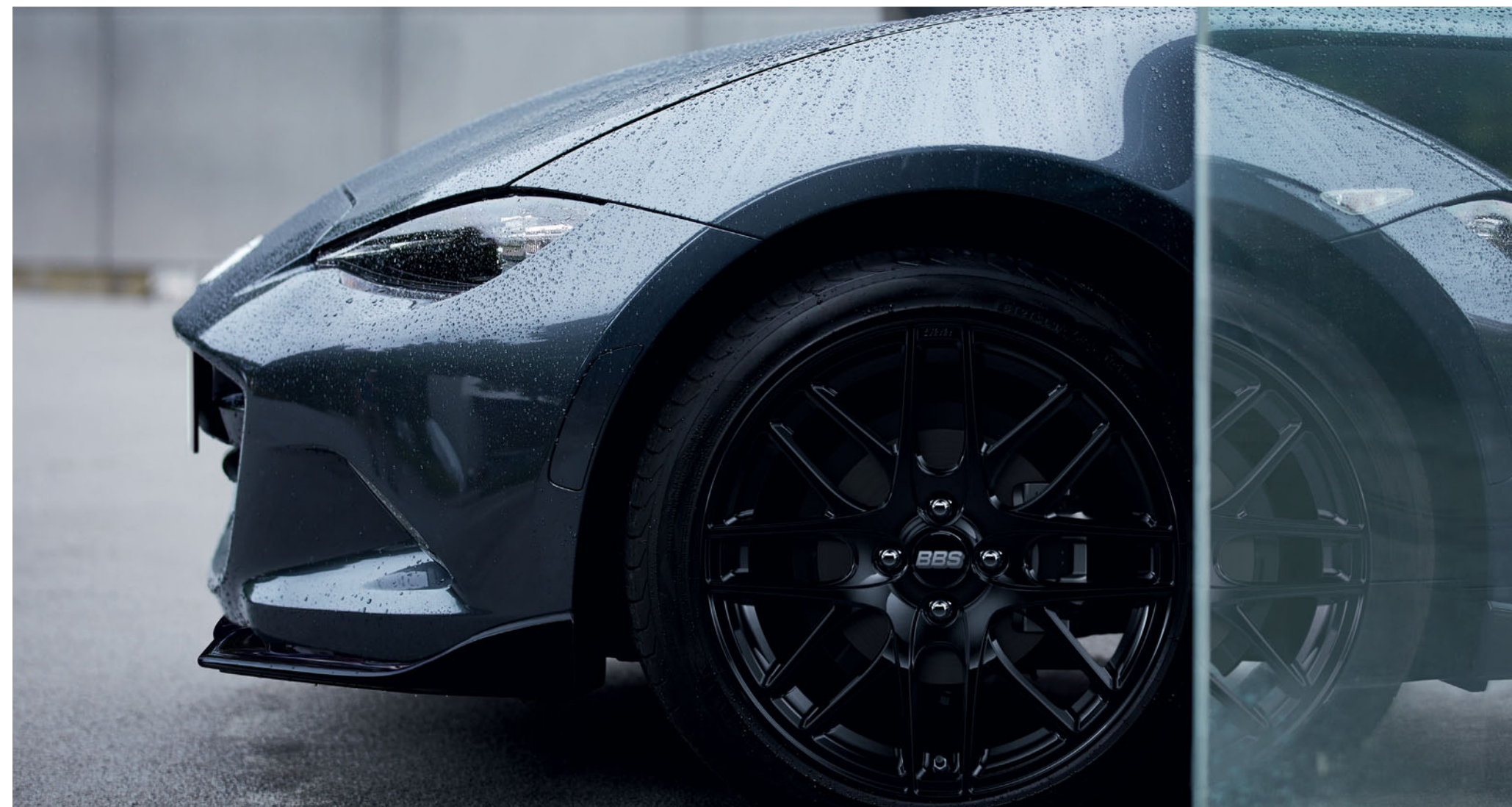
Frontschürzenlippe und Seitenschweller in Brilliant Black