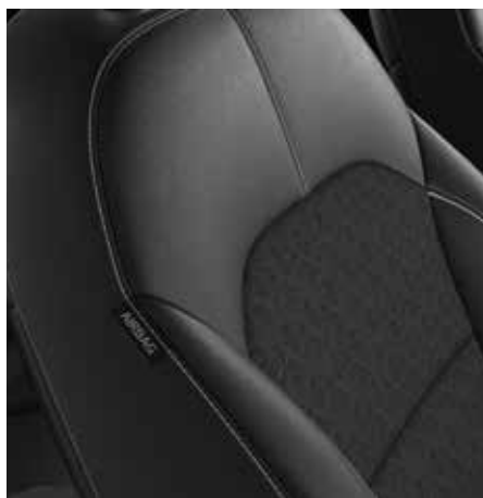
GOLD WK - Schwarz Teilleadersitze