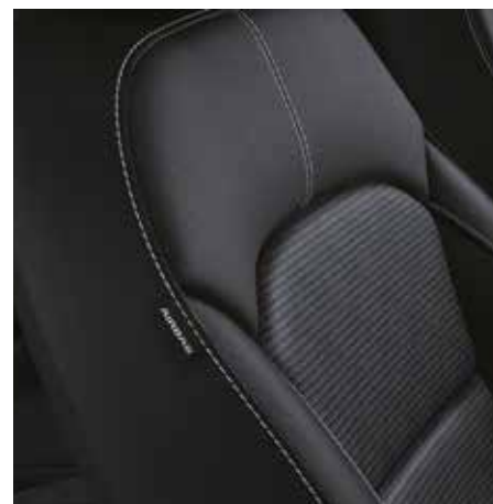
TITAN & SILBER WK - Schwarz Textilsitze