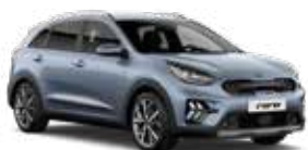
Horizon Blue (BBL) 2