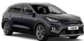
Platinum Graphite (ABT) 2