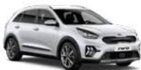
Snow White Pearl (SWP) 3