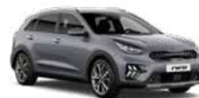
Steel Grey (KLG) 2