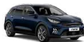
Gravity Blue (B4U) 2