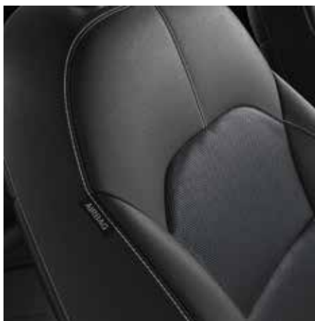
PLATIN WK - Schwarz Echtleadersitze