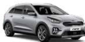
Silky Silver (4SS) 2