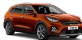
Orange Delight (DRG) 2*