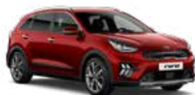
Runway Red (CR5) 2*