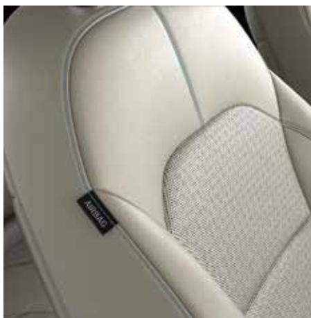
PLATIN CGS - Grau Echtleadersitze