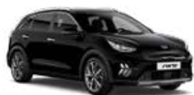
Aurora Black Pearl (ABP) 3