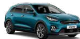
Deep Cerulean Blue (C3U) 2