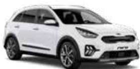
Clear White (UD) 1