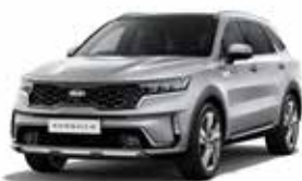
Silky Silver (4SS) 2