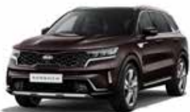
Essence Brown (BE2) 2