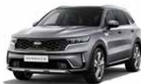
Steel Gray (KLG) 2