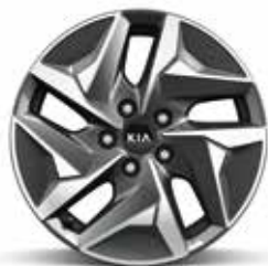
Titan & Silber (HEV) Leichtmetallfelgen 17 Zoll mit 235/65 R17 Bereifung

Informationen zu den Reifen in Bezug auf Kraftstoffeffizienz und andere Parameter gemäß Verordnung (EU) 2020/740 finden Sie auf unserer Website unter www.kia.com/at/kaufberater/reifenlabel-information