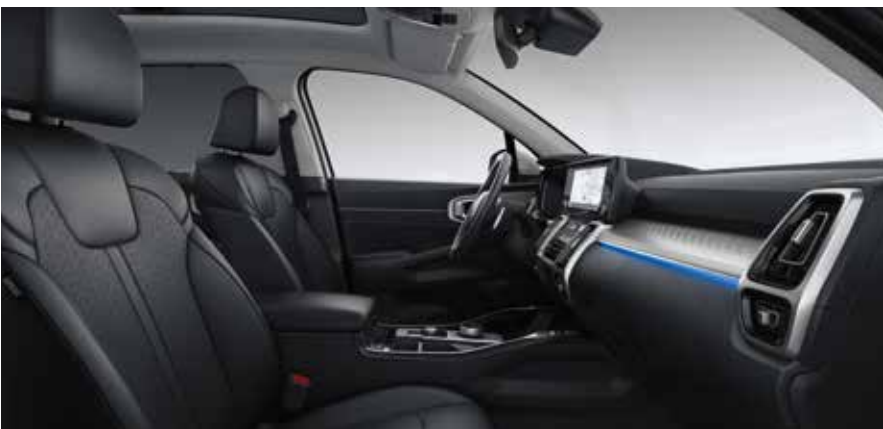
Innenkonzept Premium Schwarz Gold (HEV, PHEV) & Platin (Diesel) Echtleadersitze