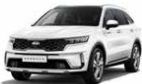
Snow White Pearl (SWP) 3