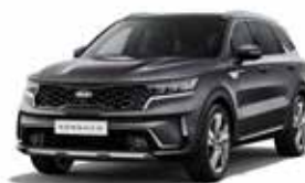
Platinum Graphite (ABT) 2