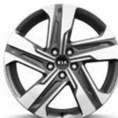
Gold (HEV) Titan, Silber & Gold (PHEV) Leichtmetallfelgen Räder 19 Zoll mit 235/55 R19 Bereifung