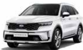
Clear White (UD) 1