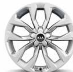
Platin (Diesel) Leichtmetallfelgen 20 Zoll mit 255/45 R20 Bereifung

Symbolfotos zeigen Kia Sorento Platin Diesel