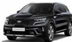
Aurora Black Pearl (ABP) 3