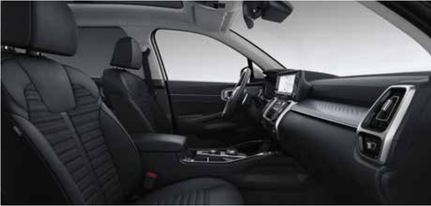
Innenkonzept Schwarz Titan & Silber (HEV, PHEV) Textilsitze