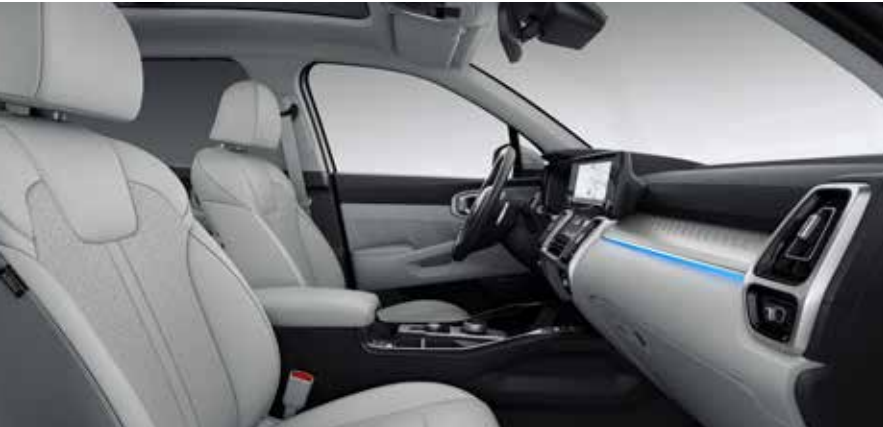
Innenpaket premium Grau/Schwarz Gold (HEV, PHEV) & Platin (Diesel) Echtleadersitze