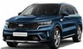
Gravity Blue (B4U) 2