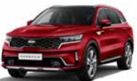
Runray Red (CR5) 2