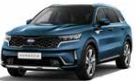
Mineral Blue (M4B) 2